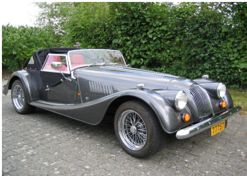
J'avais une belle Morgan grise ...