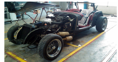
Un jour je l'ai apportée pour la passer au CT, et ils ont commencé à tout démonter...