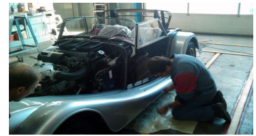
Remettre les morceaux du puzzle ensemble et à la bonne place...